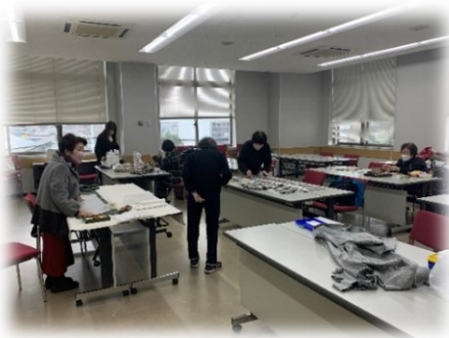
前年度の講座の様子